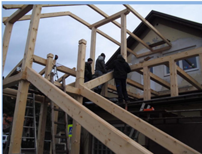
Půdní vestavba pokračuje