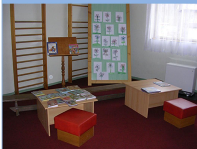
Modernizace Obecní knihovny