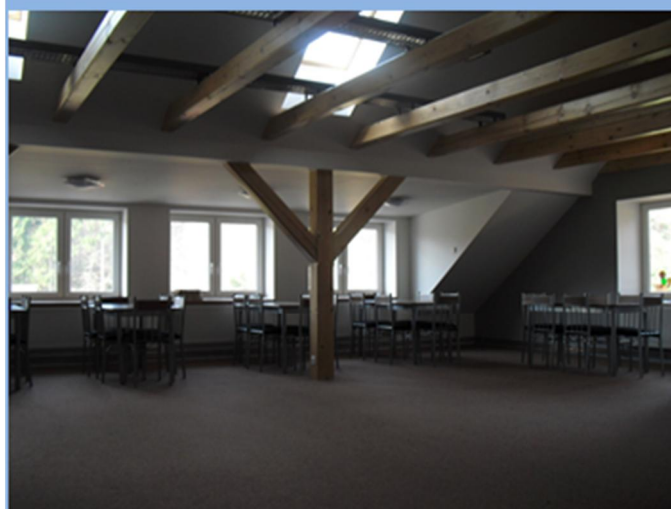
Interiér půdní vestavby OÚ