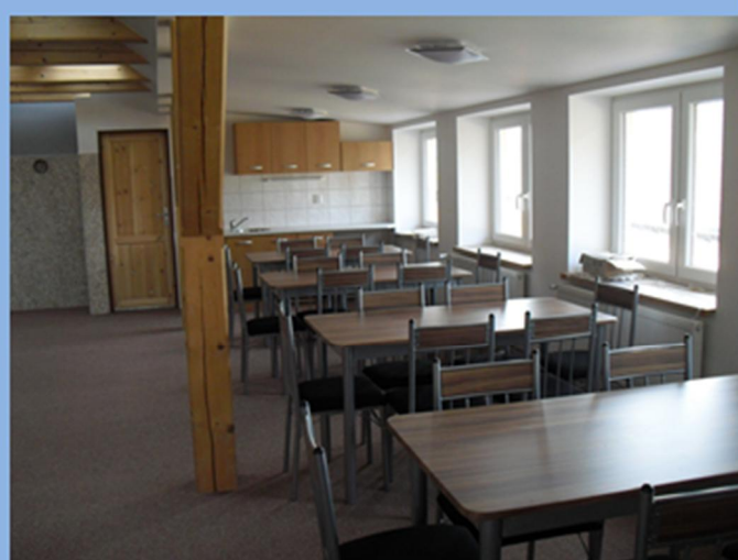
Interiér půdní vestavby OÚ