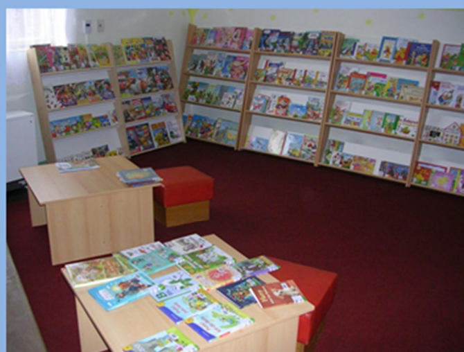
Modernizace Obecní knihovny

Prosečenský KURÝR, čtvrtletně vydává nákladem 250 výtisků a distribuci zajišťuje Obec Prosečné dostupný též v elektronické podobě na www.obecprosecne.cz Vydavatel: Obec Prosečné, Prosečné čp. 37, 543 73, IČO: 00278203 Povoleno Ministerstvem kultury ČR pod ev.č. MK ČR E 20457 Odpovědný redaktor: Jiří Novák Nevyžádané podklady a rukopisy se nevracejí.