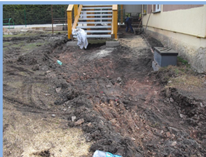
Terénní úpravy u MŠ