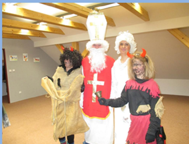
Besídka pro seniory