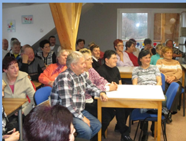
Besídka pro seniory