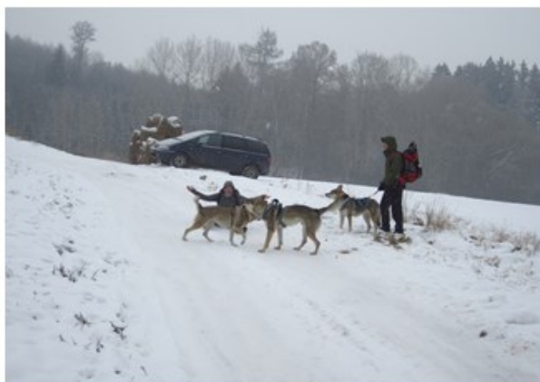
„Zimní sen“ Prosečné

Vernisáž a slavnostní zahájení výstavy fotografií v kostele sv. Alžběty Uherské.