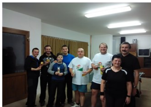
Medailisté ping pongu