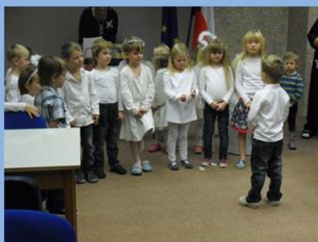
Besídka pro seniory