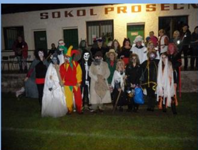
Strašidelné loučení s létem