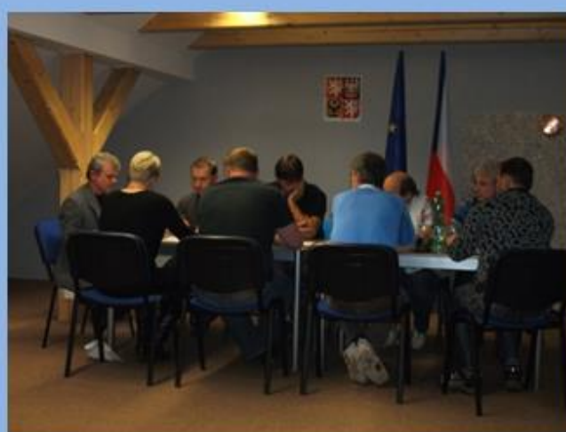
Ustavující zasedání ZO

Prosečenský KURÝR, čtvrtletně vydává nákladem 250 výtisků a distribuci zajišťuje Obec Prosečné dostupný též v elektronické podobě na www.obecprosecne.cz Vydavatel: Obec Prosečné, Prosečné čp. 37, 543 73, IČO: 00278203 Povoleno Ministerstvem kultury ČR pod ev.č. MK ČR E 20457 Odpovědný redaktor: Jiří Novák Nevyžádané podklady a rukopisy se nevracejí.