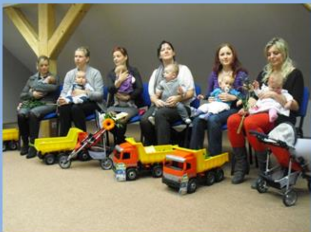
Vítání nových občánek