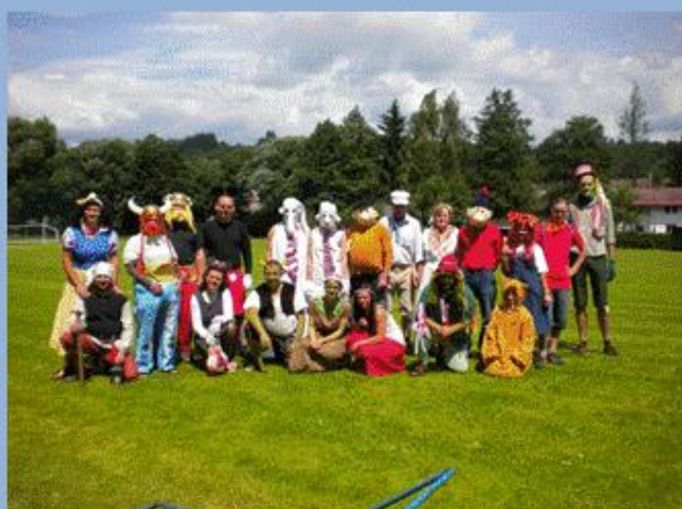
Cesta za pohádkou

Prosečenský KURÝR, čtvrtletně vydává nákladem 250 výtisků a distribuci zajišťuje Obec Prosečné dostupný též v elektronické podobě na www.obecprosečne.cz