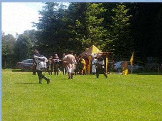
Dětský den – Legenda Aurea