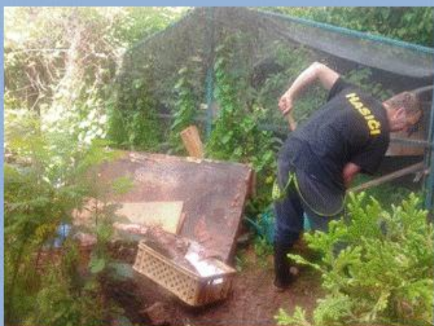
Odstraňování následků povodní