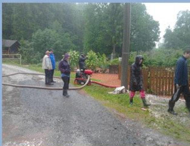
Odstraňování následků povodní