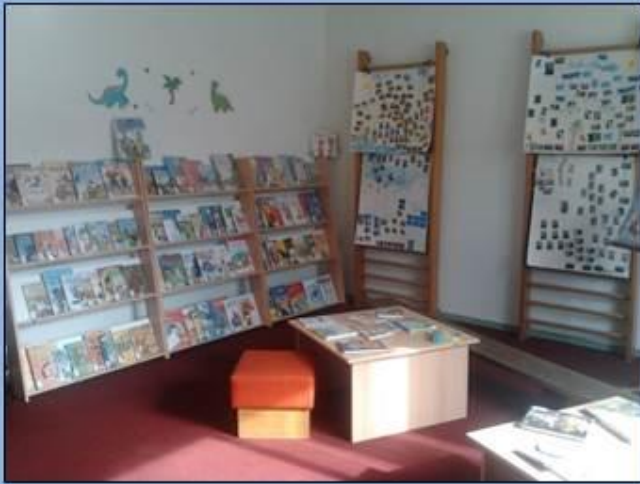
Knihovna má novou místnost pro mladé čtenáře