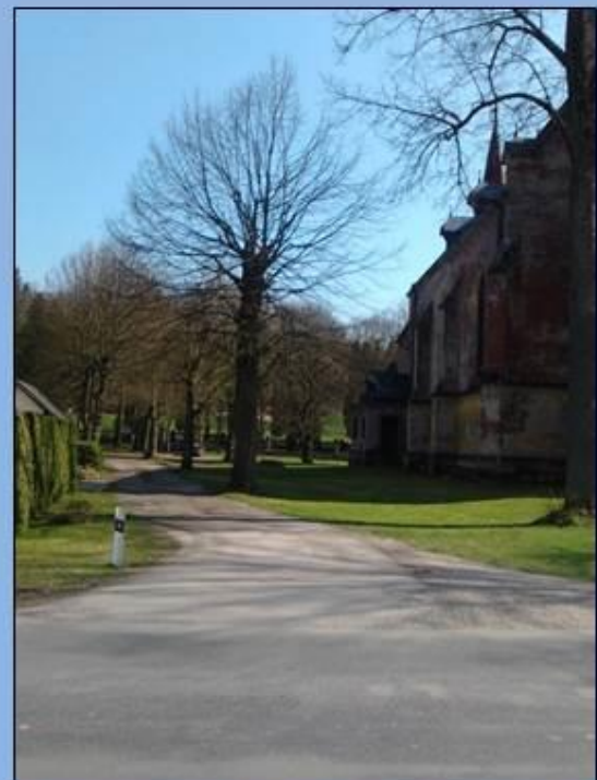
Cesta ke hřbitovu dostane nový kabát

Prosečenský KURÝR, čtvrtletně vydává nákladem 250 výtisků a distribuci zajišťuje Obec Prosečné dostupný též v elektronické podobě na www.obecprosečne.cz