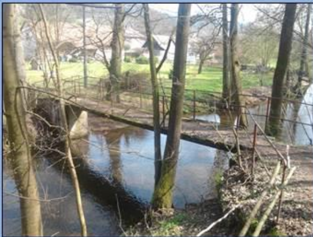
Rekonstrukce čeká i lávku pod Šrámkovými